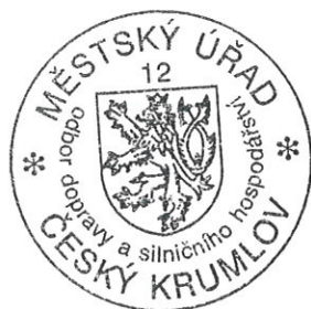
Vladimír Augsten referent ODaSH

Nedodržení termínů nebo dalších podmínek uvedených v rozhodnutí opravňuje správní orgán zahájit řízení o přestupku s možností uložení pokuty do 500 000 Kč.