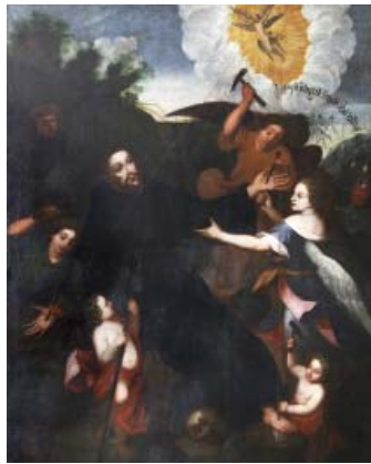
Stigmatizace, obraz je ve vlastnictví Ryfířského řádu Křižovníků s červenou hvězdou