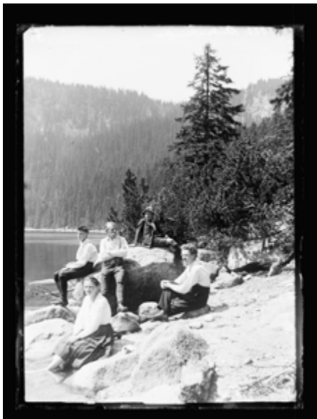
Rodina Seidelova na výletě na Plešném jezeře