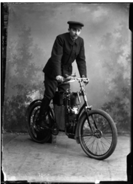
Motocykl Laurin a Klement z roku 1905 v ateliéru s neznámým řidičem