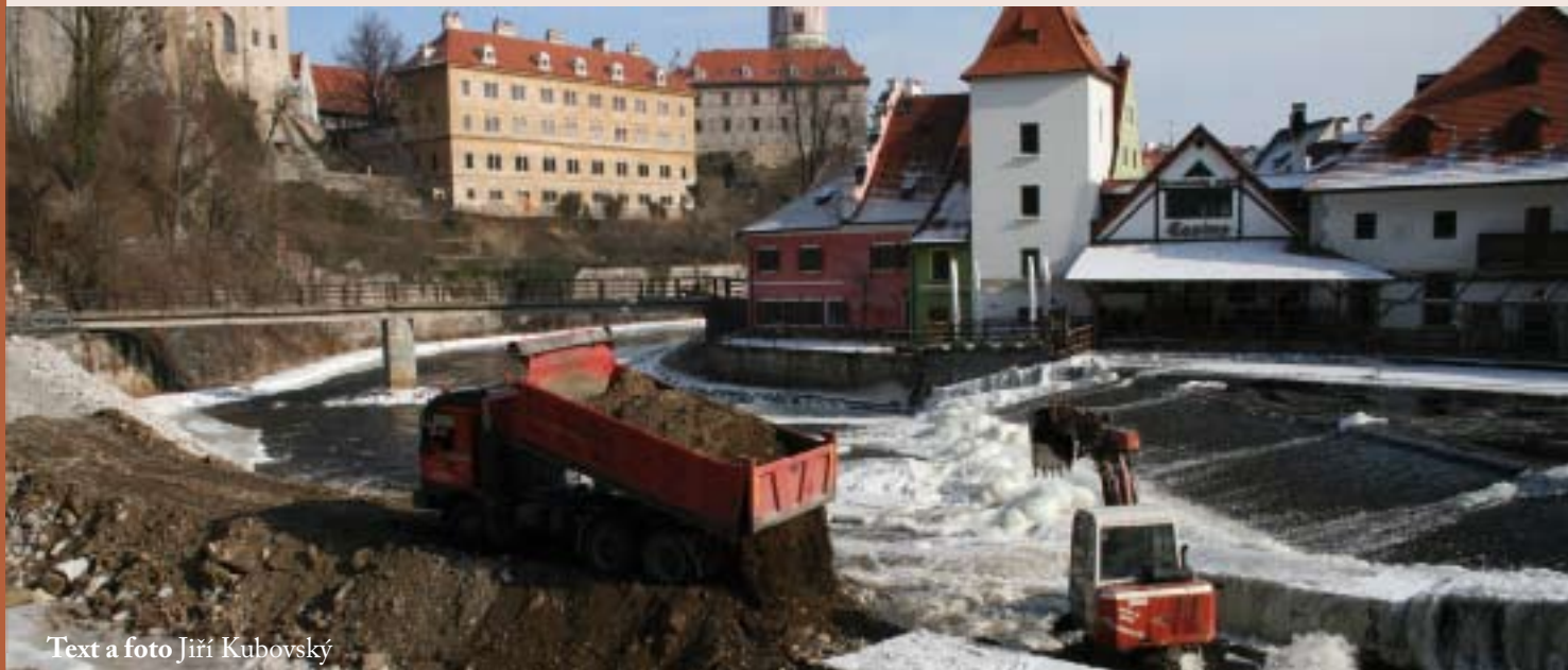
Text a foto Jiří Kubovský

Město Český Krumlov zahájilo v prosinci stavební práce na rekonstrukci lávky přes náhon u mlýna v Široké ulici a v březnu tohoto roku začnou práce i na lávce přes Vltavu u mostu Na Pláští. Souběžně s rekonstrukcemi lávek probíhá v Českém Krumlově stavba nového jezu na řece Vltavě, jejímž investorem je Povodí Vltavy.